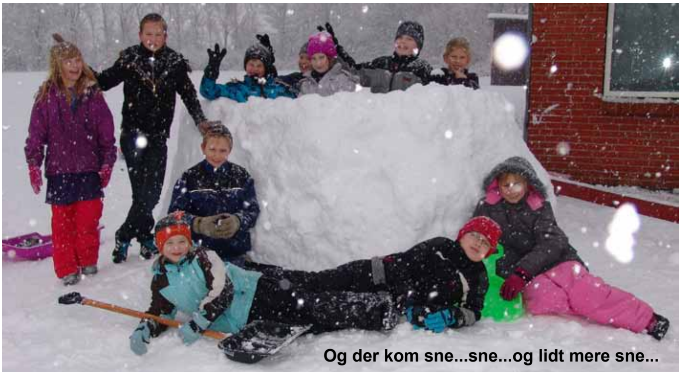
Og der kom sne...sne...og lidt mere sne...

Lige efter juleferien kom sneen. Den var længe ventet og eleverne fik lov til at boltre sig i den skønne sne. Det massive snefald i januar resulterede også i en fridag, da skolen blev snelukket. Her er det eleverne fra 2. - 3. klasse, der samarbejder om opførelsen af en sneborg. Karina