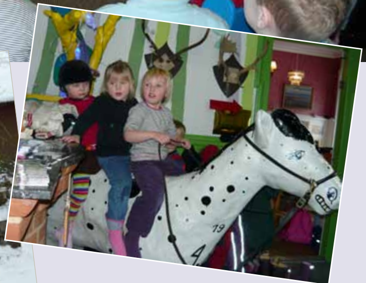
Tilbage i børnehaven: Den store snemand på børnehavens legeplads, fungerer også som snehule.