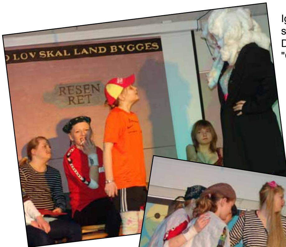
Igen i år var der skuespillere på scenen ved årets skolefest. Dramaholdet opførte stykket "Celle #13".