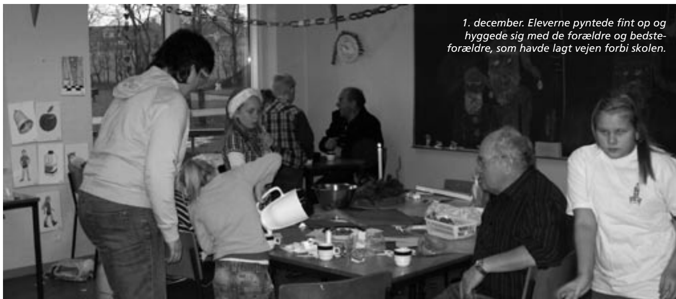
1. december. Eleverne pyntede fint op og hyggede sig med de forældre og bedsteforældre, som havde lagt vejen forbi skolen.